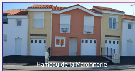
Hameau de la Maronnerie